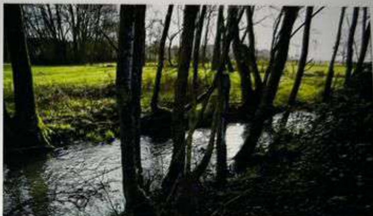
Les cours d'eau et la Loire se sont asséchés cet été. Ils ont retrouvé leur niveau habituel en ce début d'année 2023.

Les précipitations correspondent pourtant aux normales de saison, avec un excédent en septembre-octobre, et un déficit en novembre-décembre. « Il est tombé 75 millimètres depuis le début du mois, de manière assez homogène dans le département. On n'attend pas beaucoup plus de précipitations d'ici le 31, on devrait donc atteindre les 75 voire 80 millimètres, ce qui est dans la normale », précise Franck Barraer, climatologue à Météo France. « La pluviométrie a été suffisante pour que le débit des fleuves et rivières soit satisfaisant », ajoute le préfet, attentif à la situation de l'eau et attaché à surveiller les débits. « Je fais attention à ce que tous les usages en eau soient respectés, sachant que l'eau potable prévaut sur tous les usages. » Mais pour une recharge réellement effective des nappes, il faudrait « plusieurs hivers avec beaucoup de pluie », note-t-on du côté de la BRGM. « Les sols sont bien humides, mais on n'a